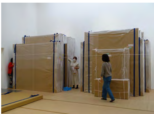
「GENKYO展」のための作品搬出作業 2020年12月24日～27日 横尾忠則現代美術館にて