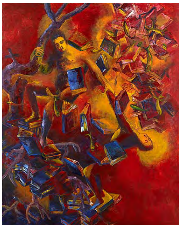
《方舟に持ち込む一冊の本》 1996年 アクリル・布 作家蔵(横尾忠則現代美術館寄託)