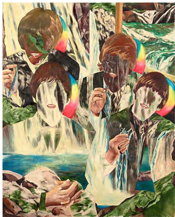
《落下するビートルズ》 1991年頃 162.2×130.6cm 油彩・布 作家蔵（横尾忠則現代美術館寄託）

当館に着任後まもなく、アーカイブルームにあった謎の着古した T シャツ（しかも額入り）の正体を調べてみるとジョン・レノンからのプレゼントと判明。その後、大量のビートルズ関連の記事の切り抜きから横尾さんのビートルズマニアぶりを知ったことが「ヨコオ・マニアリズム vol.1」の企画に繋がりました。本作ではビートルズの背景に滝が描かれています。13000 枚の滝の絵葉書を収集したという横尾さんの変わらぬ偏執狂ぶりが窺えます。「横尾忠則 肖像図鑑」（川崎市市民ミュージアム）のポスター（2014 年）では背景が鯨幕のようなストライプになっていた。「もしかして Abbey Road ですか？」と聞いてみたら「それは気づかなかった」と言われました。ところで気になるのはメンバーが手にしている魚。謎です。(M)