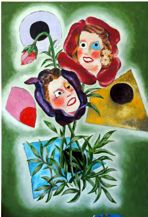
《妖花》 2017年 130.3×89.4cm 油彩・布 作家蔵（横尾忠則現代美術館寄託）

2017 年から 18 年にかけて集中的に描かれた謎めいた女性像の中の一点。この連作に共通するのは様々な日用品（キャベツや帽子、トイレトペーパーなど）によって女性の顔の一部が覆い隠されているという点ですが、本作は中でもやや変わり種。女性の顔が花と一体化しているばかりか、奇妙な紙切れが目元に重なり、福笑いのように歪んでいます。2015 年の「幻花 幻想幻画譚」展に展示した瀬戸内寂聴さんの小説『幻花』の挿絵（1974～75 年）の中にも、これに似た珍妙な生きものが登場します。どちらもうす気味悪いけれど、どこかチャーミング。(Y)