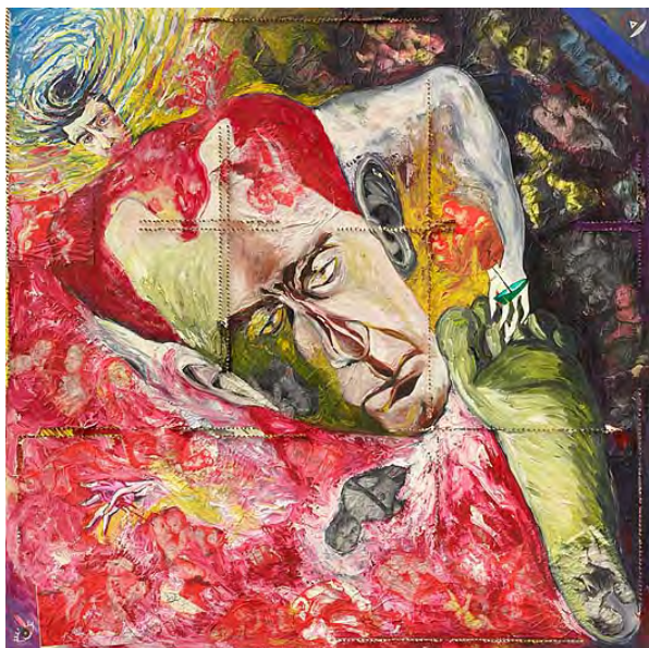
《マン・レイの夢》 1987年頃 194.0×194.0cm 油彩、コラージュ、釘・布 作家蔵（横尾忠則現代美術館寄託）

1987年の横尾さんの日記に「板に釘でマンレイのポートレイトを描く」というメモがあったので探してみたら、本当にありました。アイロンの底部に鋏を貼り付けた作品《贈り物》からのインスピレーションでしょうか。マン・レイの顔もどことなくアイロンっぽく見えます。当時の横尾さんはダダとシュルレアリスムの作家から大いに刺激を受けていました。(M)