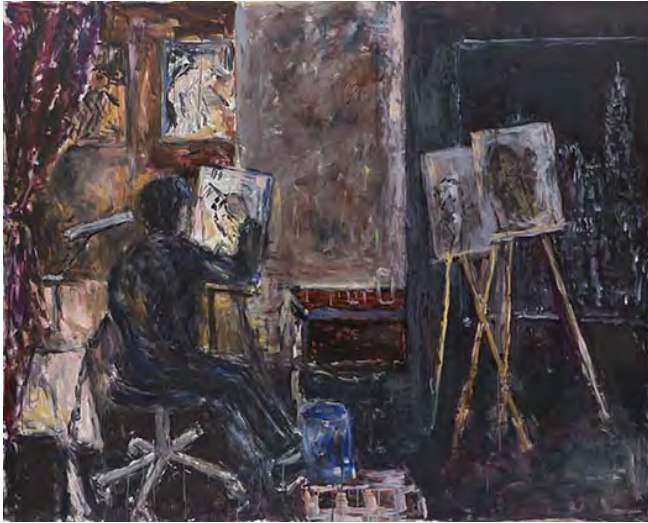
《近未来への出発》 2019年 181.8×227.3cm アクリル・布 作家蔵（横尾忠則現代美術館寄託）

「横尾忠則 大公開制作劇場」展の開幕日に行われた公開制作で描かれた作品。展覧会図録のカバーに使われた 2005 年の熊本市現代美術館での公開制作の写真をもとに、構図が類似したフェルメールの《絵画芸術》を重ね合わせて描かれました。細部を省いたぼんやりと曖昧なタッチは、以降の横尾さんの作品の特徴を先取りするもので、まさに「近未来への出発」を記念する作品となっています。(Y)