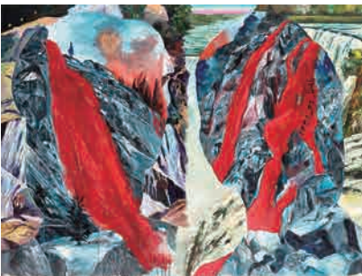
Z-5 《時代の肖像》 1991年 横尾忠則現代美術館蔵