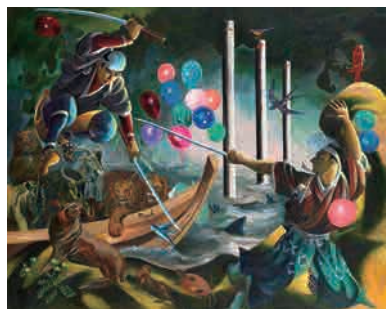
Z-10 《大入満員》 1994年 作家蔵(横尾忠則現代美術館寄託)