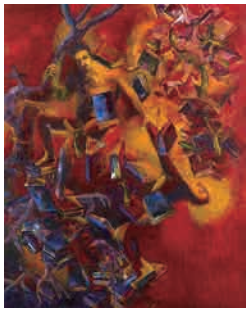
Z-1 《方舟に持ち込む一冊の本》 1996年 作家蔵(横尾忠則現代美術館寄託)