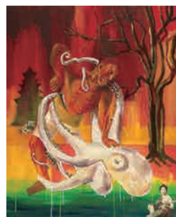
Z-7 《大阪の親戚に魚屋の力松という人がいた。ぼくが母と一緒にこの人の家を訪ねると、きまったように「タコ食うか?」といってタコの足を切った。この力松のおっちゃんがある日、ぼくの家に着ドンドン屋を連れてインチキ石鹸を売りに来た。そして夜になると三味線と太鼓で怪しげなパフォーマンスをするのだった。》 2001年 作家蔵(横尾忠則現代美術館寄託)