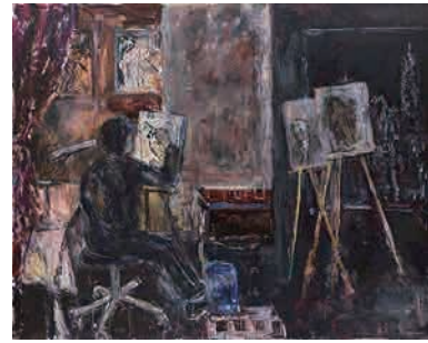
Z-2 《近未来への出発》 2019年 作家蔵(横尾忠則現代美術館寄託)