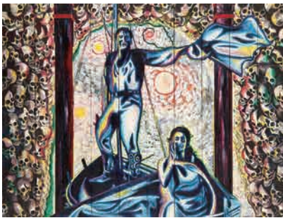
Z-3 《死者の洞窟》 1985年頃 横尾忠則現代美術館蔵