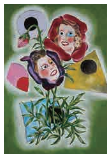
Z-11 《妖花》 2017年 作家蔵(横尾忠則現代美術館寄託)