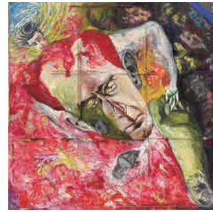
Z-4 《マン・レイの夢》 1987年頃 作家蔵(横尾忠則現代美術館寄託)