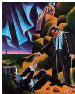
Z-9 《同士討ち》 1994年 作家蔵(横尾忠則現代美術館寄託)

Yokoo Tadanori Museum of Contemporary Art Y+T MOCA 横尾忠則現代美術館