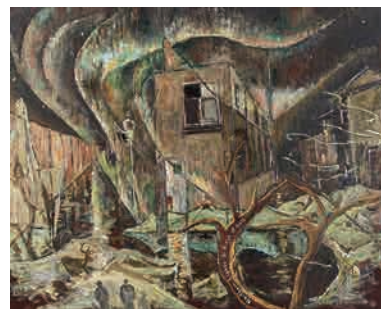
Z-10 《黄金の荒野に北極光》 2012年 作家蔵(横尾忠則現代美術館寄託)