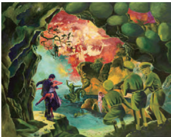
《地球の果てまでつれてって》 1994年 182.1×227.9cm アクリル・布 作家蔵 (横尾忠則現代美術館寄託)