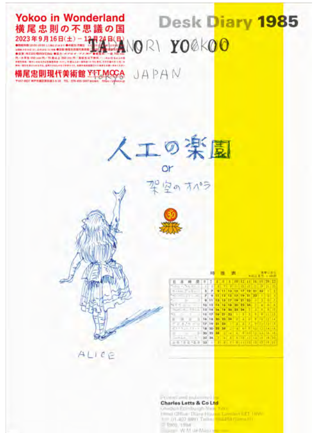
ポスターデザイン:横尾忠則