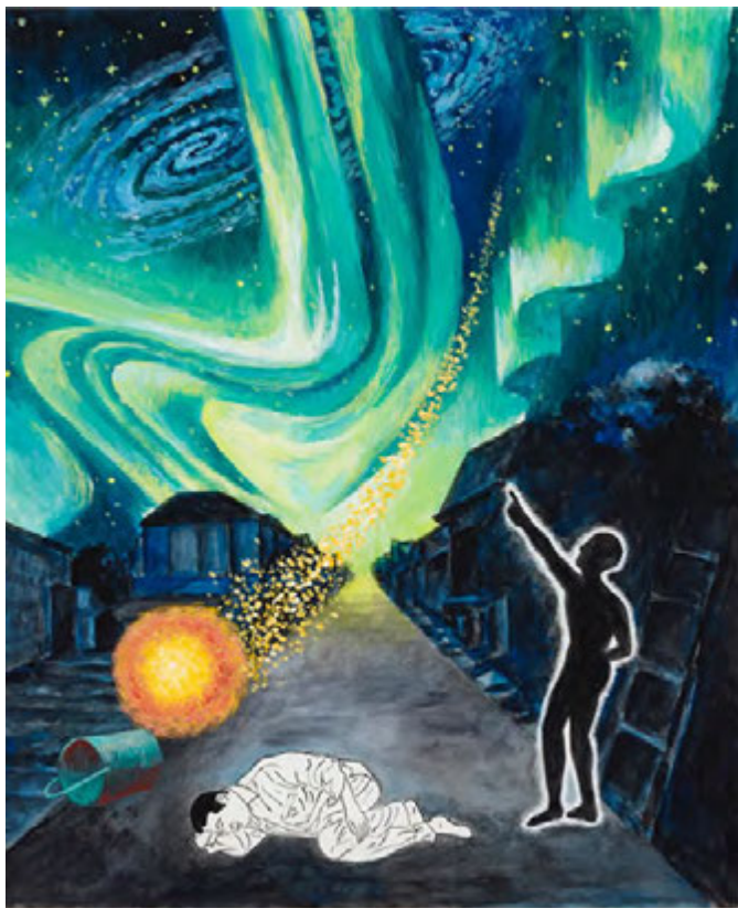
《夢枕 二十六》 1998年 45.1×37.9cm 水彩・紙 作家蔵（横尾忠則現代美術館寄託）

《夢枕》は、1998年に出版された『夢枕—夢絵日記』の原画です。本展では、42編の絵日記と表紙のための原画全43点を一堂に展示します。