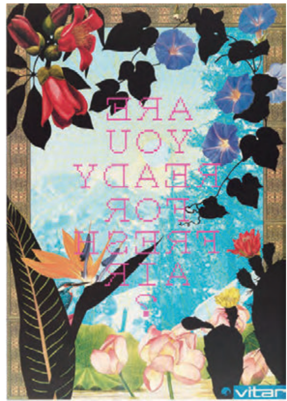
《Are You Ready for Fresh Air? (Vitar)》