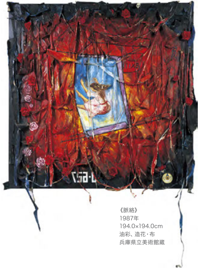
《脈絡》 1987年 194.0×194.0cm 油彩、造花・布 兵庫県立美術館蔵

その先には若き日の横尾さんが関心を寄せた地底の王国アガルタがあり、少年時代の横尾さんが夢中になった探検小説の洞窟があり、愛読したジュール・ヴェルヌの海中世界が広がります。さらに、宇宙では異星人と出会ったり、死の向こうにある「ぶるうらんど」を覗き見たりと、異界での冒険は続きます。