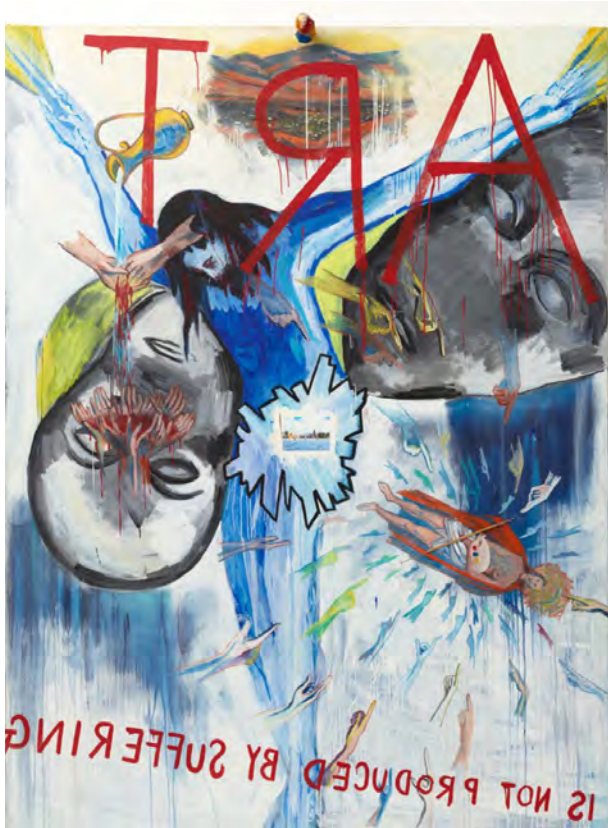
《Art is not Produced by Suffering》

鏡の破片のコラージュや鏡文字を多用し、実像と虚像が入り乱れる狂気の世界が展開する第2章は、1980年代後半の作品を中心に構成されています。