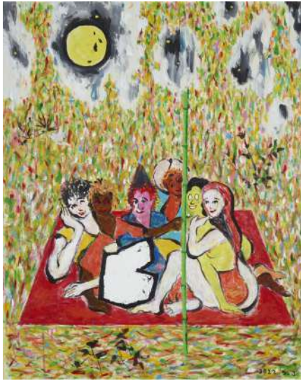
《2022-05-03》 2022年 162.1 × 130.3 cm、アクリル・布 作家蔵

《2022-05-01》は久隅守景(生没年不詳)筆《納涼図屏風》(17世紀、東京国立博物館蔵)の一部から構図がとられています。男性は着物ではなく現代風の洋服らしきものを身につけており、女性はエドゥアール・マネ(1832-1883)の《草上の昼食》(1862-63年、オルセー美術館蔵)に由来して、何も身につけず脚を前方に投げ出しています。寒山と拾得の要素はほぼ失われているものの、親子が座る赤い敷物はこの時期の寒山百得シリーズに共通しているモチーフであり、比較すると明らかな連続性があります。2日後に描かれた《2022-05-03》もまた同様の構図を用いているものの、登場人物が増え、個性も強調されていることから、まったく異なる集いになっています。