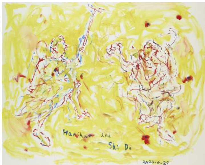
《2023-06-27》 2023年 181.8 × 227.3 cm、アクリル・布 作家蔵