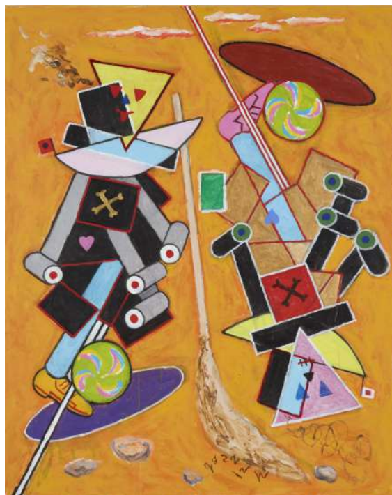
《2022-12-12》 2022年 162.1 × 130.3 cm、アクリル・布 作家蔵

文章のように長かったり、駄洒落になっていたり何かしらを引用したものだったり、魅力的なタイトルも横尾作品の特徴のひとつですが、本展では珍しくタイトルが全てその作品の制作日になっています。そして、作風の変遷を見せたいという横尾の希望に沿って、原則として制作順に展示しています。タイトルに示された日付は鑑賞者である私たちが生きてきた時間とも重なっており、例えば《2022-12-12》が描かれた時期にちょうど開催されていた2022FIFAワールドカップなどは記憶にも新しいでしょう。画面をよく見ると、トランプの絵札よろしく上下反転するみたいに描かれた2人の人物は各々サッカーボールを蹴っているようですし、芯の部分が赤く塗られたトイレットペーパーは日本の国旗にも見えてきます。横尾も4年に1度の世界的なイベントに熱狂したのでしょうか。その作品が描かれた時に世の中では何が起きていたか、自分は何をしていたか考えていたか。そんな自分自身の記憶と照らし合わせて鑑賞するのも楽しいかもしれません。