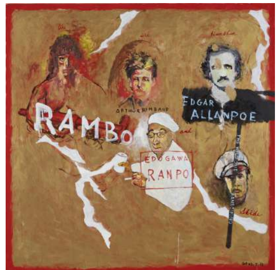
《2023-02-13》 2023年 162.1 × 162.1 cm、油彩・布 作家蔵