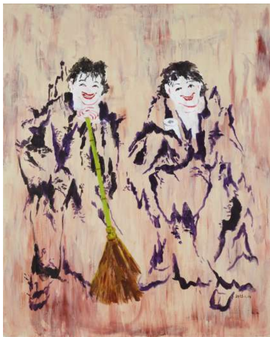
《2023-01-14》 2023年 162.1 × 130.3 cm、アクリル・布 作家蔵

本展では制作順に作品を展示していますので、横尾の中の寒山拾得像がおおよそ1年の間にいかに変遷していったかにもぜひご注目ください。