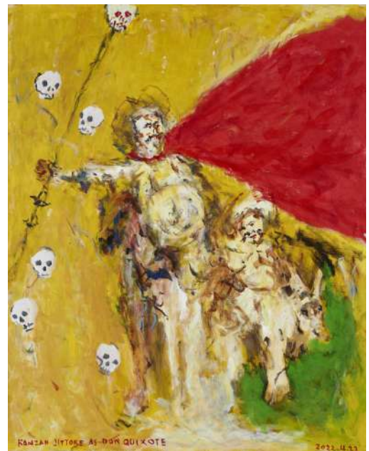
《2022-04-23》 2022年 162.1 × 130.3 cm、アクリル・布 作家蔵

《2022-04-21》からは突然郷土ドン・キホーテと従者サンチョ・パンサのシリーズが始まります。寒山はともかく拾得は、実は寒山に付き従う陰のようなもので、その存在はさらに曖昧であるという説もあるそうです。そうだとすれば、この2組の関係性を重ねて見ることもできるでしょう。それまで敷物として画面における印象的な要素だった赤い布は、ここからはマントへ様変わりしています。《2022-04-23》は、マドリードのスペイン広場に立つドン・キホーテとサンチョ・パンサの像をモデルにしています。「Clear Light」シリーズ(1974)や《ネモ船長ピカソに遭遇》(2007)など横尾が何度もその作品を参照してきたギュスターヴ・ドレ(1832-1883)がドン・キホーテの物語の挿絵も手掛けていることから、寒山百得シリーズにおいて急に現れたように見えるこの2人のモチーフにも実は理由があるのかもしれません。