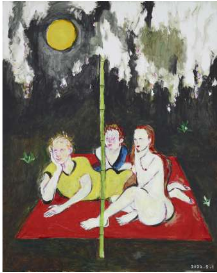
《2022-05-01》 2022年 162.1 × 130.3 cm、アクリル・布 作家蔵