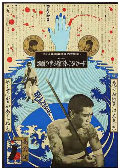
横尾忠則《切断された小指に捧げるバラード(八九三書房)》 1966年 | 102.6×72.0cm | シルクスクリーン・紙 横尾忠則現代美術館蔵

1969年にはその思いが昂じて写真集『高倉健賛江』(天声出版)を編集するも出版に至らず、1971年に新たに編集した『憂魂、高倉健』が発行された。しかし、これも諸事情で書店に並ぶことはなく、2009年に復刻版が完成した。