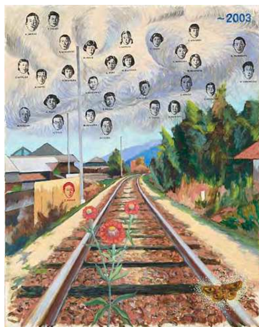
横尾忠則《友の不在を思う》 2003年 91.2×72.8cm | 油彩・布 横尾忠則現代美術館蔵