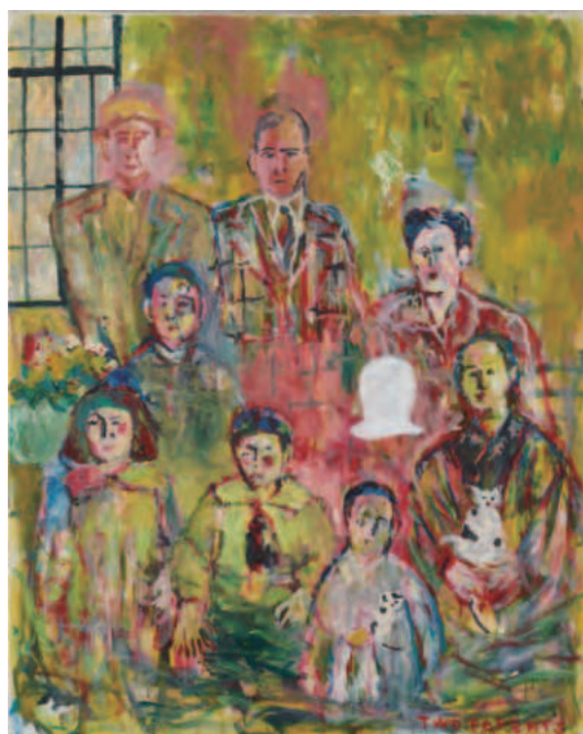
横尾忠則《家族の会合》 2021年 161.1×130.3cm | 油彩・布 横尾忠則現代美術館蔵

それから30年後の2000年、西脇市岡之山美術館での個展「西脇・記憶の光景展」の出品作を現地で制作するため、横尾は西脇に約2週間滞在した。この時、懐かしい線路の風景に、他界した同窓生の姿を重ねた作品が生まれた。本展出品作《友の不在を思う》は、その後旅立った友人たちを描き加えたもの。故郷の思い出を共有した友人たちへの供養の儀式なのだろう。