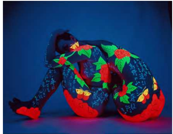
篠山紀信《Kaleidoscope》1968年(プリント：2014年) 100.0×150.0cm | インクジェットプリント・アルミ複合板 横尾忠則現代美術館蔵

1964年、横尾が和田誠を誘って参加したヨーロッパへの団体旅行で、横尾は和田の同僚であった篠山と知り合う。1968年からは横尾の写真集企画『私のアイドル』のために横尾と横尾の憧れの人物を、1970年には雑誌の企画のため横尾の故郷をともに訪ねて記憶の光景を記録し、1974年には横尾の初めてのインド旅行に同行するなど、篠山は1960年代から70年代の横尾の姿を数多く撮影している。