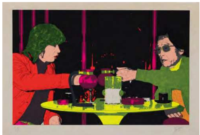
横尾忠則《うろつき夜太 II》1993年 38.4×56.2cm | シルクスクリーン・紙 横尾忠則現代美術館蔵