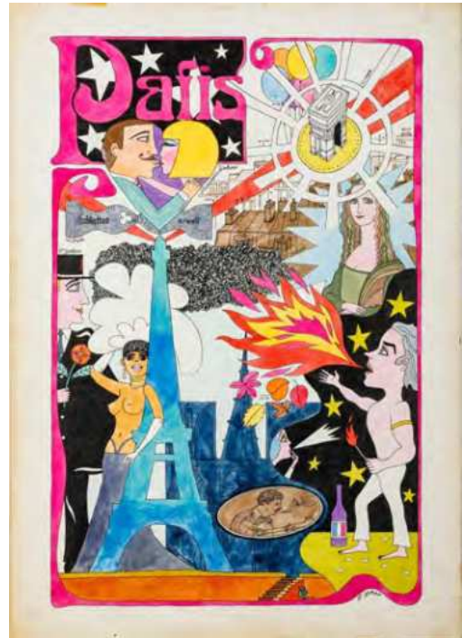
横尾忠則、和田誠《ヨーロッパ観光ポスター集『デザイン』No.69 [原画]》1965年 51.4×36.3cm | インク、カラーインク、アクリル・紙 横尾忠則氏蔵 | ©Yokoo Tadanori ©Wada Makoto

1965年より1995年まで雑誌『話の特集』のアートディレクションを担当し、創刊号の表紙に横尾を抜擢した。強烈な個性ゆえ賛否両論であったものの、和田はその才能を信じて押し通したという。編集長は矢崎泰久、執筆陣に寺山修司、永六輔、写真に篠山紀信、立木義浩、イラストレーションに宇野亞喜良、長新太らを迎え、ジャンルを超えて様々な表現者が集結し、カウンターカルチャーを代表する雑誌であった。