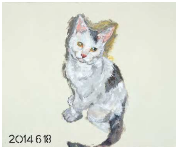
横尾忠則《タマ、帰っておいで 005》 2014年 38×45.5cm | アクリル・布 横尾忠則現代美術館蔵

以後2020年まで、在りし日のタマの写真をもとにタマを偲んで描いた絵画は91点を数える。