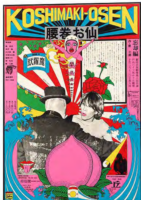
横尾忠則《腰巻お仙(劇団状況劇場)》1966年 103.2×72.2cm | シルクスクリーン・紙 横尾忠則現代美術館蔵

横尾に唐十郎を紹介したのは寺山修司であった。出会いから数日後、唐は電話で公演「アリババ」のチラシを依頼したという。横尾が状況劇場のためにデザインした「ジョン・シルバー」(1965)、「腰巻お仙・忘却篇」(1966)、「由比正雪」(1968)、「続ジョン・シルバー」(1968)のポスターは、横尾のグラフィックデザイナー時代の代表作となっている。