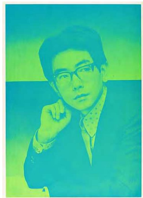
横尾忠則《「サイコ・デリシャス」のためのポートレート： 一柳慧（草月アートセンター）》 1968年 | 103.1×73.3cm シルクスクリーン・紙 | 横尾忠則現代美術館蔵

1969年にはLPレコード『一柳慧作曲「オペラ横尾忠則を歌う」』を制作。高倉健が歌う「網走番外地」の替歌「横尾忠則賛歌」や一柳のミュージック・コンクレートが収録されている。