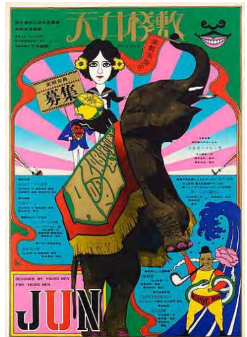
横尾忠則《天井桟敷 定期会員募集(天井桟敷)》1967年 103.0×72.8cm | シルクスクリーン・紙 横尾忠則現代美術館蔵

横尾は劇団の定期会員募集ポスターをはじめとするポスターデザインのほか、旗揚げ公演「青森県のせむし男」や、「大山デブコの犯罪」の舞台美術を担当した。また、1983年、寺山の死から半年後に行われた追悼公演「青森県のせむし男」においても美術を手がけた。