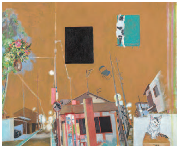
横尾忠則《黒い空洞》 2014年 130.3×162.1cm | アクリル・布 横尾忠則現代美術館蔵