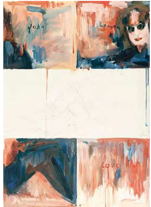
横尾忠則《Love John Lennon (新評論)》1981年 103.0×72.8cm | オフセット・紙 横尾忠則現代美術館蔵

横尾はビートルズファンを公言しており、彼らの来日13日前に、法被を着てJALのバッグを手にするメンバーを描いている。1967年のニューヨーク滞在時にはジャスパー・ジョーンズを通じてジョン・レノン、オノ・ヨーコと面会を果たし、オノとの友情は現在も続いている。本展に出品されているTシャツとサイン入りレコードは2人の自宅を訪れた時のプレゼントである。