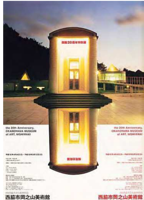
横尾忠則《開館20周年特別展 横尾忠則展(西脇市岡之山美術館)》2004年 | 72.8×51.5cm | オフセット・紙 横尾忠則現代美術館蔵

また、横尾の故郷、兵庫県西脇市にある西脇市岡之山美術館(1984)や、東京の横尾のアトリエ(1986)も磯崎の設計である。