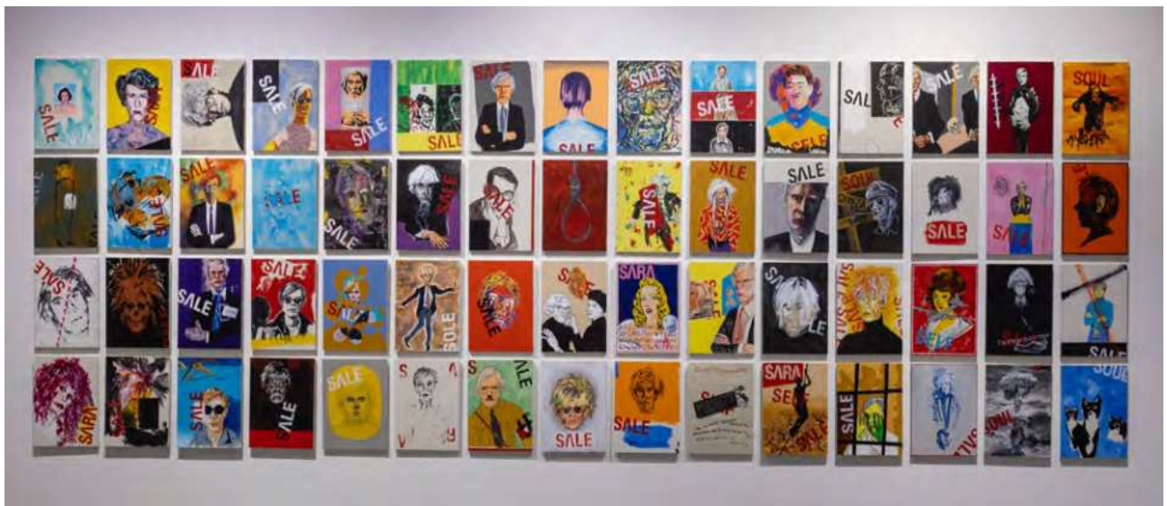
横尾忠則《A.W.Mandala》2019年 各41.0x31.8cm | アクリル・布 | 横尾忠則現代美術館蔵 ※写真は2019年の展示風景。本展では60点中、当館蔵の57点を展示

本展では、横尾の自宅に飾られているウォーホル作品4点に加え、横尾がウォーホルをモチーフに描いた60点組のシリーズ《A.W.Mandala》より、2023年に当館に寄贈された57点を一挙公開いたします。