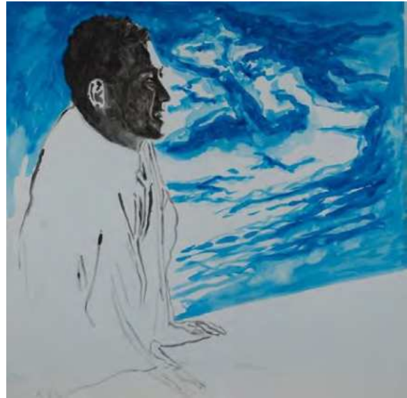
横尾忠則《ISSEY MIYAKE パリコレクション招待状 SS1988 [原画]》 1987年 | 60.2×60.2cm | アクリル・カードボード | 作家蔵

1976年秋冬コレクションにおいて、初めて横尾忠則の作品をプリントした衣服を発表、1977年からはパリコレクションの招待状を横尾が手がけている。また、2020年には新プロジェクト「TADANORI YOKOO ISSEY MIYAKE」が立ち上がり、ISSEY MIYAKEと横尾のコラボレーションは今も続いている。