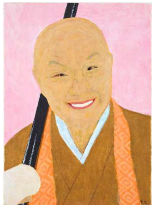
横尾忠則《瀬戸内寂聴》2009年 33.4×24.3cm | アクリル・布 作家蔵

また、瀬戸内は横尾の文才を早くから見抜いて小説の執筆を促しており、それに応えた横尾の小説『ぶるうらんど』(2008)は第36回泉鏡花文学賞を受賞した。