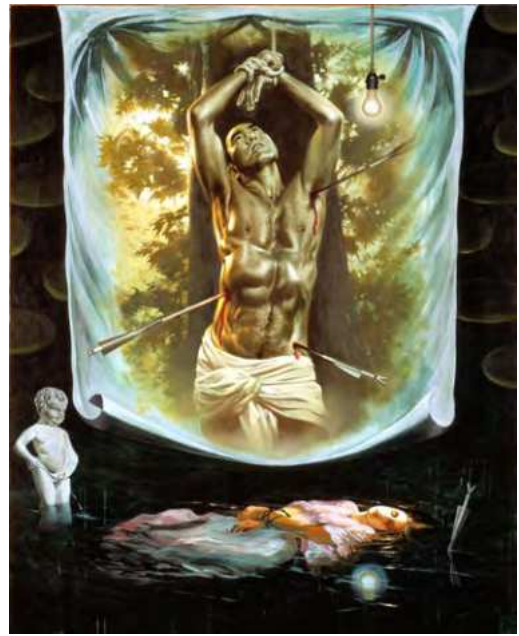
横尾忠則《理想の実現》1994年 227.3×181.8cm | 油彩、アクリル・布 兵庫県立美術館蔵

横尾にとって三島は「礼節」を説く教育者であった。1966年の横尾の個展パンフレットに「礼節のない無礼な芸術」との作品評を寄せつつ、芸術は本来無礼なものだが、芸術家は無礼であってはいけないと横尾を諭した。三島の死後もその存在は横尾の制作に影響を与え続け、あらゆる年代の作品にその姿を見つけることができる。