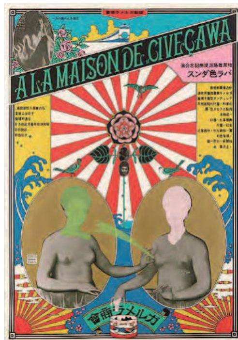
横尾忠則《A La Maison de M. Civeçawa (ガルメラ商会)》 1965年 | 105.2×73.7cm | シルクスクリーン・紙 横尾忠則現代美術館蔵

1965年の暗黒舞踏派提携記念公演「バラ色ダンス-A LA MAISON DE M. CIVEÇAWA(澁澤さんの家の方へ)」(演出・振付・出演:土方巽)のポスターは、横尾流アンチモダニズムのデザインを世に知らしめ、以降のアングラ演劇のポスターに繋がっていく。このポスターの版を利用した《土方巽 燐燐大踏鑑(ガルメラ商会)》(1970)に踊る「燐燐大踏鑑」の文字は三島由紀夫揮毫によるもので、土方の理念を表している。