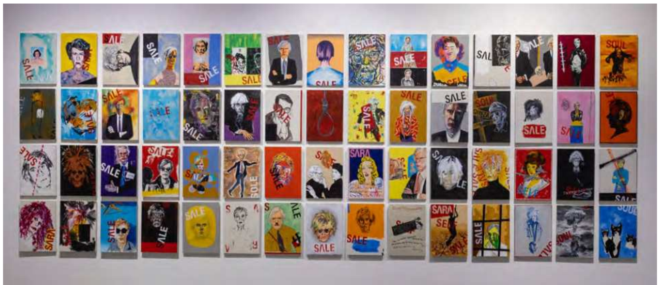
横尾忠則《A.W.Mandala》2019年 各41.0x31.8cm | アクリル・布 | 横尾忠則現代美術館蔵 ※写真は2019年の展示風景。本展では60点中、当館蔵の57点を展示

本展では、横尾の自宅に飾られているウォーホル作品4点に加え、横尾がウォーホルをモチーフに描いた60点組のシリーズ《A.W.Mandala》より、2023年に当館に寄贈された57点を一挙公開いたします。