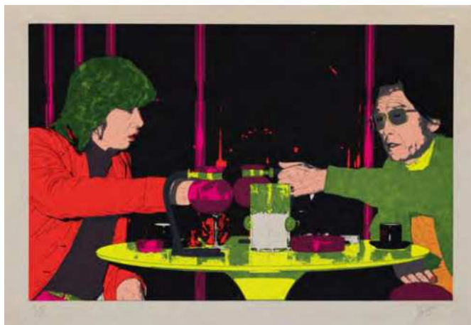
横尾忠則《うろつき夜太 II》1993年 38.4×56.2cm | シルクスクリーン・紙 横尾忠則現代美術館蔵