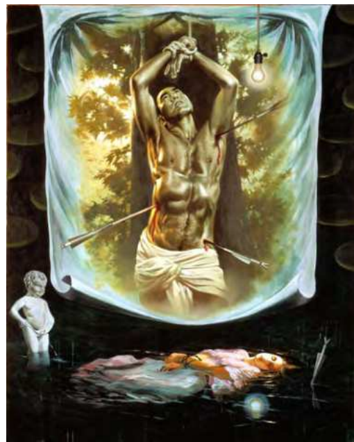
横尾忠則《理想の実現》1994年 227.3×181.8cm | 油彩、アクリル・布 兵庫県立美術館蔵

横尾にとって三島は「礼節」を説く教育者であった。1966年の横尾の個展パンフレットに「礼節のない無礼な芸術」との作品評を寄せつつ、芸術は本来無礼なものだが、芸術家は無礼であってはいけないと横尾を諭した。三島の死後もその存在は横尾の制作に影響を与え続け、あらゆる年代の作品にその姿を見つけることができる。