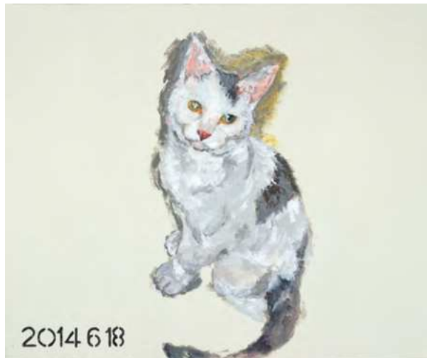
横尾忠則《タマ、帰っておいで 005》 2014年 38×45.5cm | アクリル・布 横尾忠則現代美術館蔵

以後2020年まで、在りし日のタマの写真をもとにタマを偲んで描いた絵画は91点を数える。