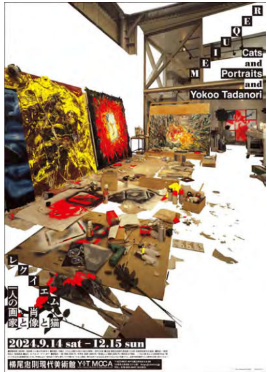
ポスターデザイン:横尾忠則