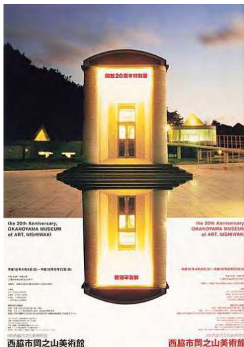
横尾忠則《開館20周年特別展 横尾忠則展(西脇市岡之山美術館)》2004年 | 72.8×51.5cm | オフセット・紙 横尾忠則現代美術館蔵

また、横尾の故郷、兵庫県西脇市にある西脇市岡之山美術館(1984)や、東京の横尾のアトリエ(1986)も磯崎の設計である。